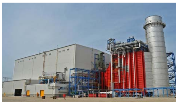
Строящаяся электростанция «Шимал-2» установленной мощностью 409 МВт

На юге Азербайджана в Лерикском районе закончено строительство электростанции «Лерик» мощностью 16,5 МВт. В перспективе предусматривается строительство парогазовой электростанции «Яшма» установленной мощностью 920 МВт.