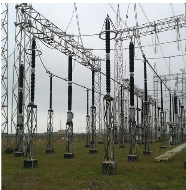
ПС-330 кВ «Имишли»

В настоящее время уполномоченными организациями Сторон подготовлены проекты документов, предусмотренные Соглашением. 13 мая 2015 года подписан новый Договор «о параллельной работе ЕЭС России и ЭС Азербайджанской Республики». Азербайджанская энергосистема работает параллельно с ЕЭС России и энергосистемой Грузии. Также осуществляется обмен электроэнергией в «островном» режиме с энергосистемой Ирана. В мае 2016 года сдана в эксплуатацию ВЛ-500 кВ «Самух-Гардабани». Введена в эксплуатацию ВЛ-330 кВ «Муган», по которой осуществляется обмен электрической энергии между Азербайджанской Республикой и Исламской Республикой Иран.