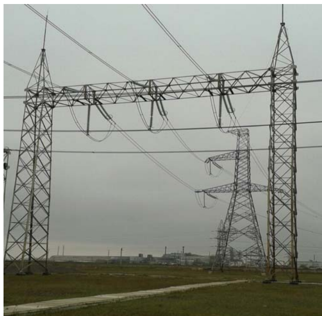
ВЛ-330 кВ «Муган»

С целью увеличения технических способностей по обмену электроэнергией между Азербайджаном и Ираном завершается строительство воздушной линии 220 кВ «ПС Масаллы-ПС Астара (ИИР)». В соответствии с Государственными программами «Социально-экономического развития регионов Азербайджанской Республики на 2014-2018 годы», «Социально-экономического развития города Баку и его окрестностей» осуществляются проекты, как по генерации, так и развитию сетей системы передачи.