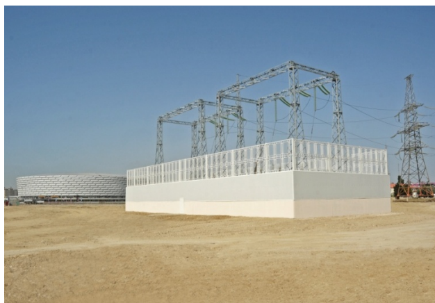
Переходное сооружение ВЛ 220кВ на кабель

В связи со строительством олимпийского спортивного комплекса часть двухцепной линии 220 кВ 1 и 2-я «Низами» и линии 110 кВ 4-я «Раманы», были заменены кабелем.