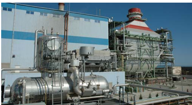
Электростанция «Шимал-1» установленной мощностью 400 МВт

В поселке Шувялан города Баку в 2002 году построена парогазовая установка установленной мощностью 400 МВт. В настоящее время рядом с существующей станцией продолжается строительство 2-го энергоблока «Шимал-2» с установленной мощностью 409 МВт.