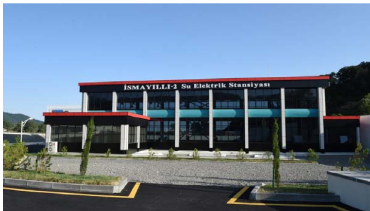
Гидроэлектростанция «Исмаиллы-2» установленной мощностью 1,6 МВт

Современная гидроэнергетика по сравнению с другими традиционными видами электроэнергетики является наиболее экономичным и экологически безопасным способом получения электроэнергии. По подсчетам специалистов, в различных регионах республики на горных реках и оросительных каналах можно осуществить строительство сотен малых гидроэлектростанций. 10 августа 2016 года Президент Азербайджанской Республики Ильхам Алиев принял участие в открытии гидроэлектростанции «Исмаиллы-2» установленной мощностью 1,6 МВт. Вода, выходящая из нижнего бьефа гидроэлектростанции «Исмаиллы-1», поступает на гидроэлектростанцию «Исмаиллы-2». Таким образом, Исмаиллинская гидроэлектростанция представляет собой каскад гидроэлектростанций общей мощностью 3,2 МВт.