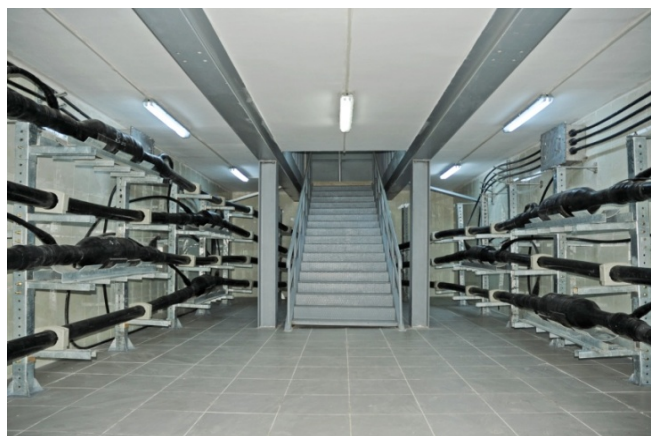
Кабельное сооружение 220кВ